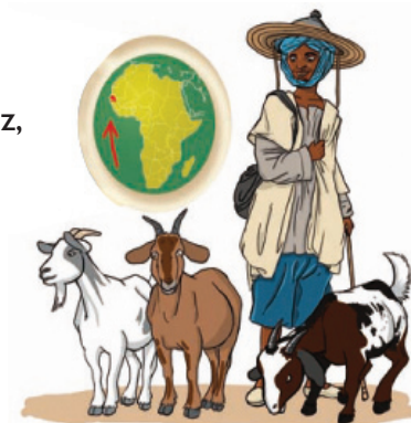
Personnage : Souleymane, le chevrier